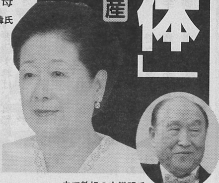
夫で教祖の文鮮明氏

13歳で文鮮明に見初められ4回帝王切開14人出産 夫の死で豹変「私が再臨のメシア」4mの彫刻像 嫁イビリ高級デパートで嫁には暗い色のドレス