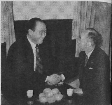
文鮮明と岸信介が握手