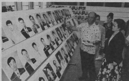
結婚するカップルを選ぶ文鮮明夫妻

「冬はマイナスイオンが二十度になり、日本人は私一人。住居は台所もトイレもないプレハブ小屋でした」(同前)