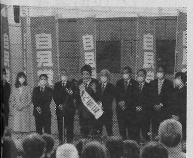
衆院選の出陣式にも信者が