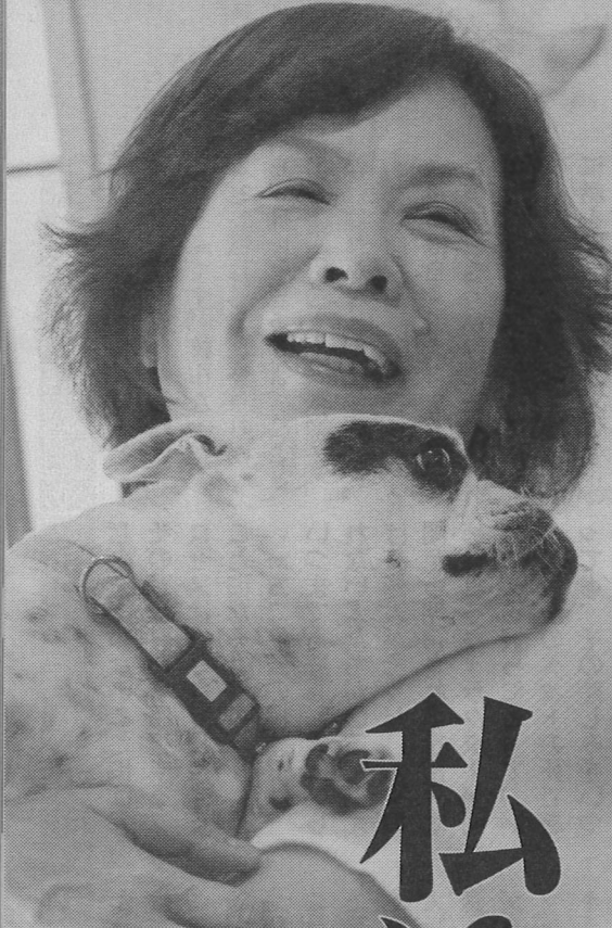
「最強のふたり」だった