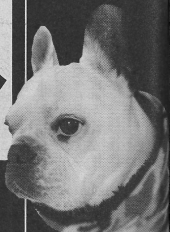
フレンチブルドッグのベベ