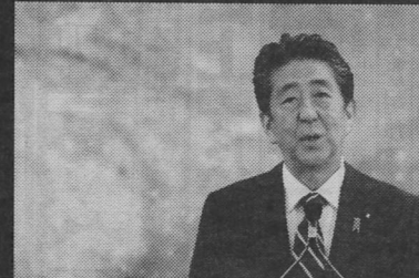
극복하여 개죄를 이룬 선수들의 모습은 세계 안에 용기와 감동을 주었으며